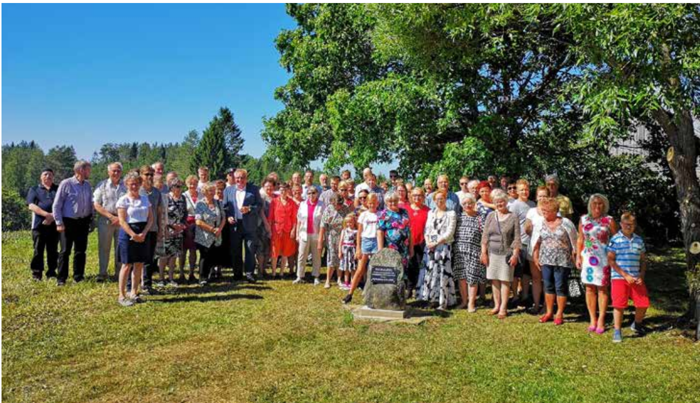
Sukukivi kertoo loputtomasta uurastuksesta. 70 Koiramäen Kotilaisten jälkeläistä oli paikalla.