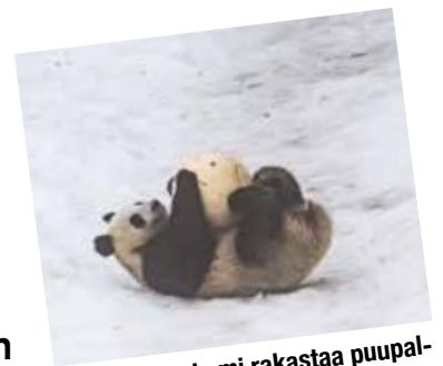
Pandakarhu Lumi rakastaa puupalloaan ja leikkii sillä mielellään.